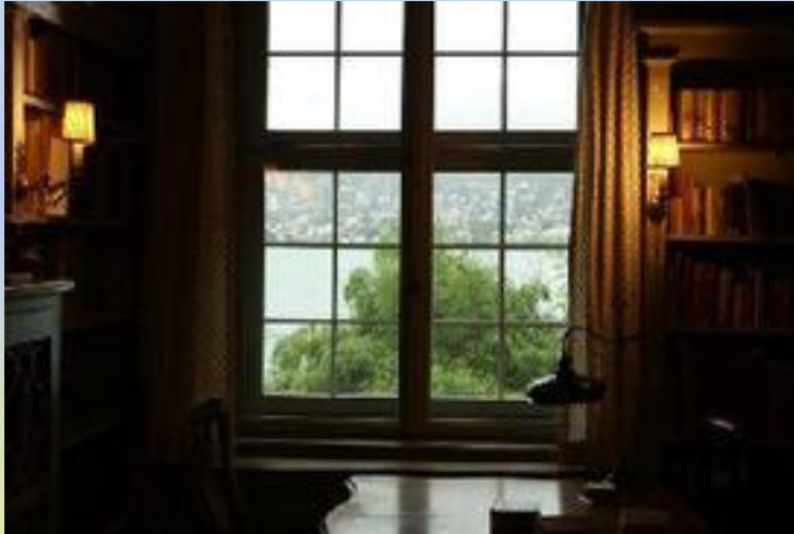
Une vue du bureau de Jung

La nouvelle cure de Jung pour les âmes : Réflexions sur la pratique de Jung et les changements ultérieurs de la Psychologie analytique